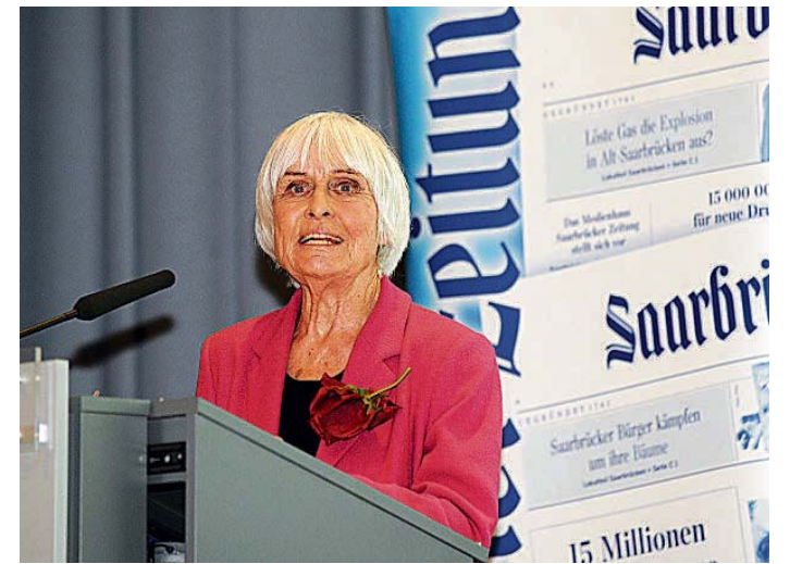
Wie man mit gesunder Ernährung auch im hohen Alter noch vital und schön sein kann: dafür ist die 83-jährige Autorin Barbara Rütting ein strahlendes Beispiel.