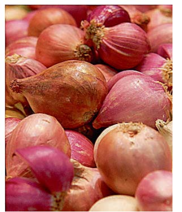
Gemüse ist eine Kohlenhydratquelle, die Diabetiker bevorzugt essen sollten.